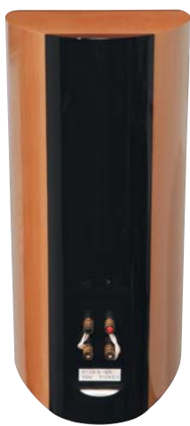
Finition absolument superbe des haut-parleurs au bout des borniers bicâblage.

empruntant la technologie de haut-parleur TAD et le savoir faire d'un bureau d'étude jeune et dynamique qui n'a visiblement pas fini de nous étonner. Beau travail, messieurs !